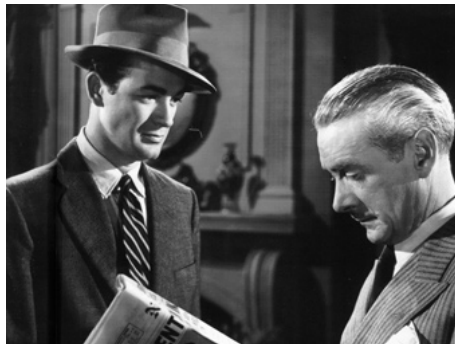
1946 L'IMPASSE TRAGIQUE (The Dark Corner) d'Henry Hathaway avec Mark Stevens