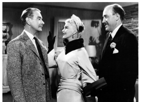
1952 UN GRAND SÉDUCTEUR (Dreamboat) de Claude Binyon avec Ginger Rogers, Fred Clark