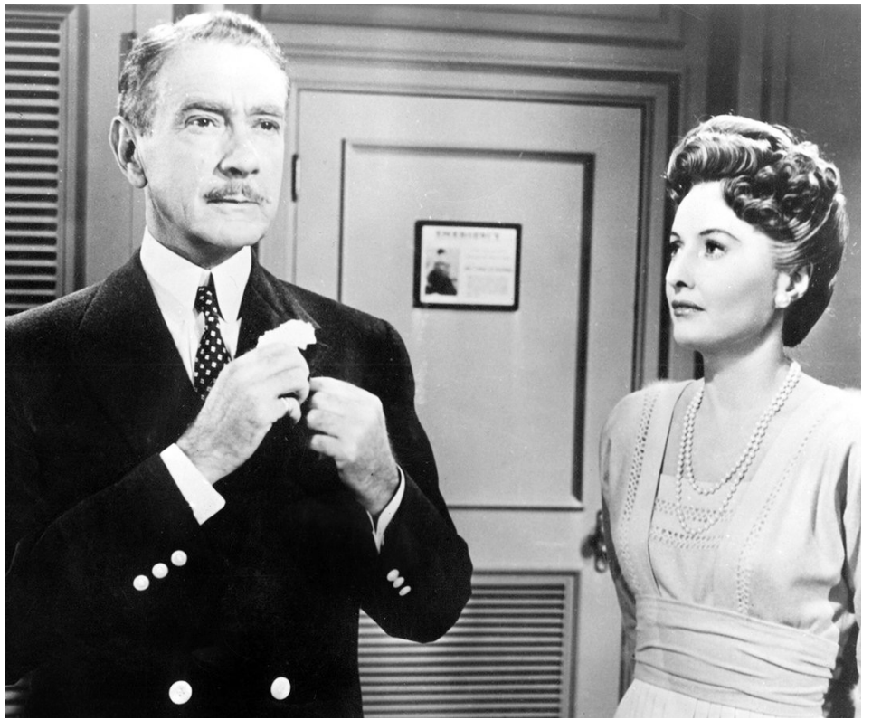
1953 TITANIC (Titanic) de Jean Negulesco avec Barbara Stanwyck