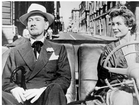
1954 LA FONTAINE DES AMOURS (Three Coins in the Fountain) de Jean Negulesco avec Dorothy McGuire