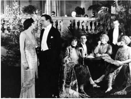
1926 CŒUR DE SIRÈNE (Heart of a Siren) de Phil Rosen avec Conway Tearle, Barbara La Marr