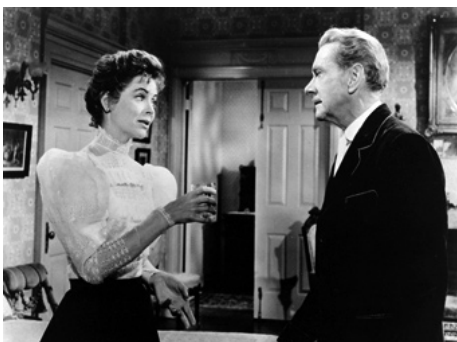
1958 LE REMARQUABLE PENNYPACKER (The remarkable Mr Pennypacker) d'H. Levin avec Dorothy McGuire