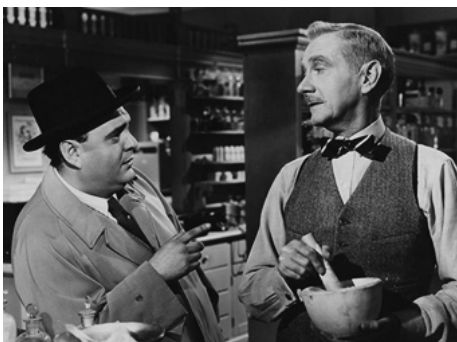
1951 M. BELVÉDÈRE FAIT SA CURE (Mr Belvedere rings the bell) d'Henry Koster avec Zero Mostel