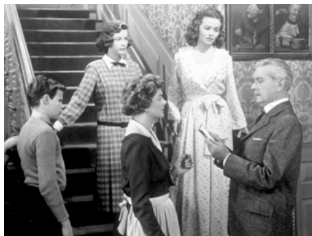
1949 TREIZE À LA DOUZAINE (Cheaper by the dozen) de W. Lang avec Myrna Loy, Jeanne Cain, Barbara Bates