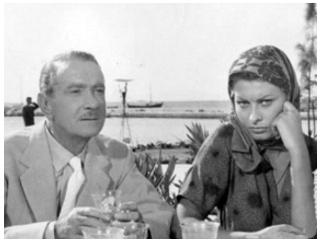
1957 OMBRES SOUS LA MER (Boy on a Dolphin) de Jean Negulesco avec Sophia Loren