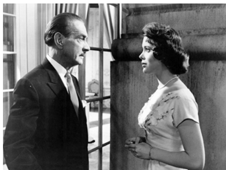
1959 QU'EST-CE QUI FAIT COURIR LES FILLES ? (Holiday for Lovers) d'H. Levin avec Jill St. John