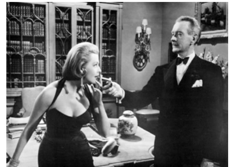
1955 LES FEMMES MÈNENT LE MONDE (A Woman's World) de Jean Negulesco avec Lauren Bacall