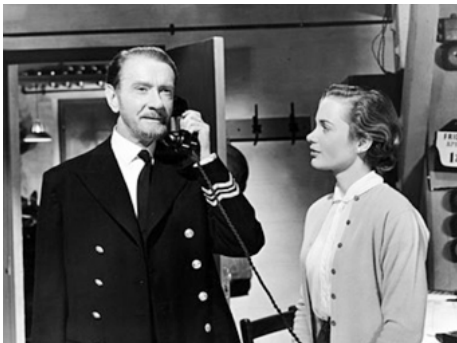
1955 L'HOMME QUI N'A JAMAIS EXISTÉ (The Man who never was) de Ronald Neame avec Gloria Grahame