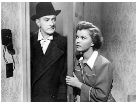
1948 M. BELVÉDÈRE AU COLLÈGE (Mr Belvedere goes to College) d'Elliott Nugent avec Shirley Temple