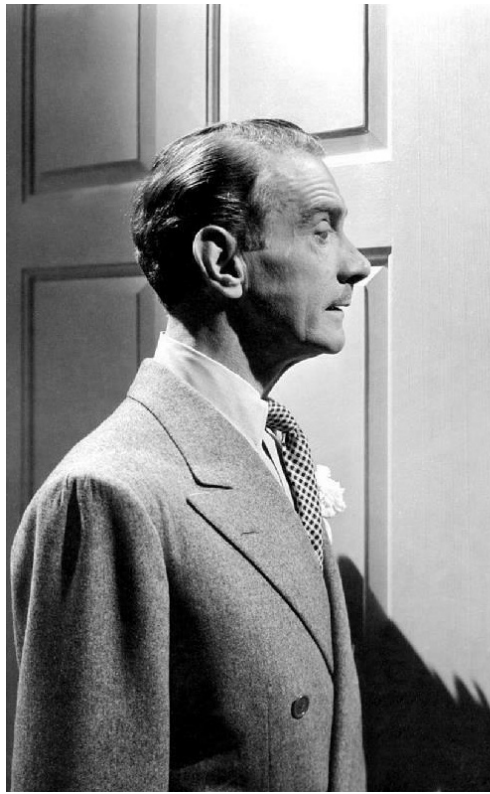
1945 LAURA (Laura) d'Otto Preminger avec Gene Tierney