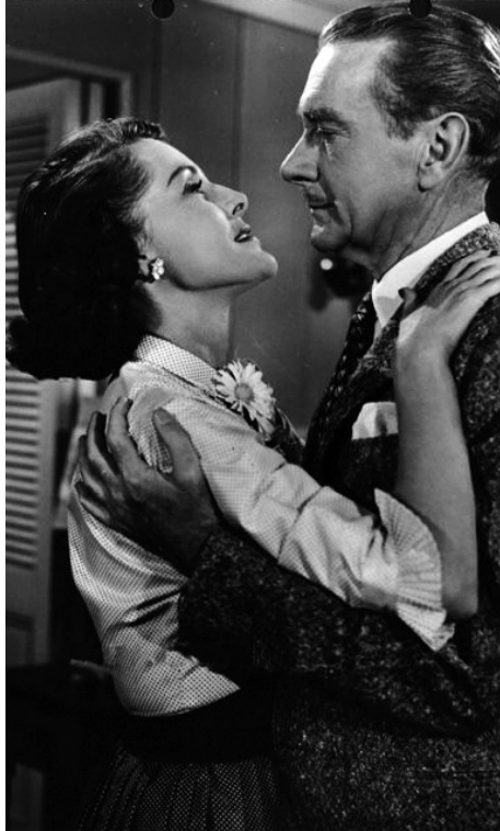
1953 TOUJOURS PRÊTS (Mister Scoutmaster) d'Henry Levin avec Frances Dee