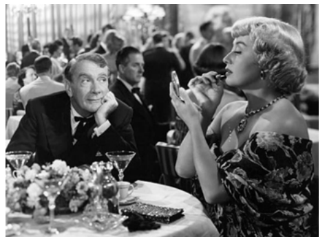
1950 ON VA SE FAIRE SONNER LES CLOCHES (For Heaven's sake) de George Seaton avec Joan Blondell