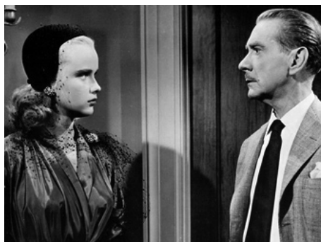
1951 ENLEVEZ-MOI MONSIEUR (Elopement) d'Henry Koster avec Anne Francis