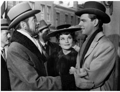
1952 LA PARADE DE LA GLOIRE (Stars and Stripes forever) d'Henry Koster avec Debra Paget, Robert Wagner